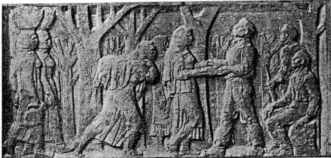
U OKU SLOBODE SADA STE VJECNI

Podnožje spomenika predstavljaju ukrštene betonske grede koje bude istovremeno asocijacije na snagu naroda, ropstvo i nedaće. U borbi protiv tog ropstva herojski su pali borci čiji ostaci počivaju u četiri betonska sarkofaga. Sarkofazi su obloženi bronzanim pločama na kojima reljefi ilustriraju život ova naroda i herojsku borbu za njegovu pobjedu.