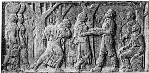
U OKU SLOBODE SADA STE VJECNI