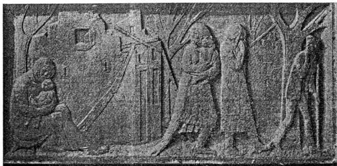
DALI STE ŽIVOT I SADA STE VJECNI

Bila je to teška i uporna četverogodišnja borba svih naših naroda, na kraju koje smo slavili pobjedu. I povijest se još jednom ponovila, da smo baš ovdje, pod ovom utvrdom dali jedan od odlučujućih poraza neprijatelju. Pod zidinama ovoga grada odigrala se jedna od najznačajnijih bitaka NOR-a — Kninska bitka u kojoj su fašisti doživjeli sudbinu svojih pretodnika. Ta borba dostiže vrhunac krajem 1944. godine kad