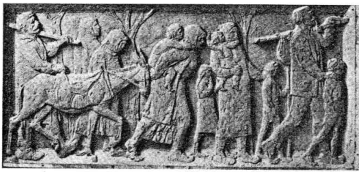
U ZJENI BRATSTVA SADA STE VJECNI