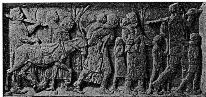
U ZJENI BRATSTVA SADA STE VJECNI

Po broju učesnika i strategiji ratovanja bila je to odlučujuća bitka za oslobođenje Dalmacije i cijele naše zemlje u kojoj su sudjelovali borci VIII korpusa (9, 19, 20. i 26. divizija i prekomorske jedinice NOVJ) sa ukupno 26.000 boraca iz svih krajeva naše zemlje. I u neprekidnoj četrdesetodnevnoj