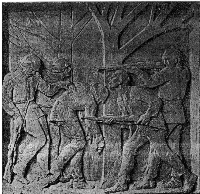
Borba sa neprijateljem — detalj sa sarkofaga

je okupator odlučio da pod svaku cijenu zadrži Knin, da bi omogućio prolaz hiljadama fašističkih beznadnika koji su se iz Grčke, Albanije i Jugoslavije povlačili u Njemačku.